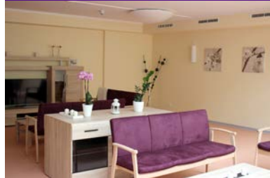
Moderne, altersgerechte Ausstattung