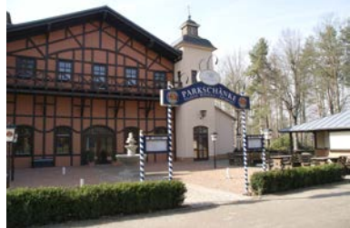
Die Parkschenke im Stadtpark