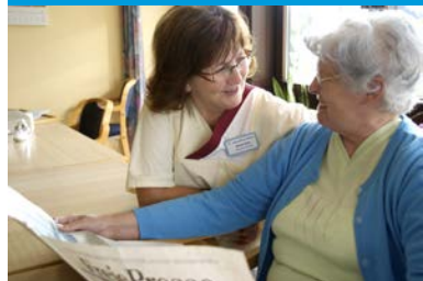
Betreut wohnen im Anna-Esche-Haus