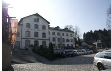
Anna-Esche-Museum am Johannisplatz